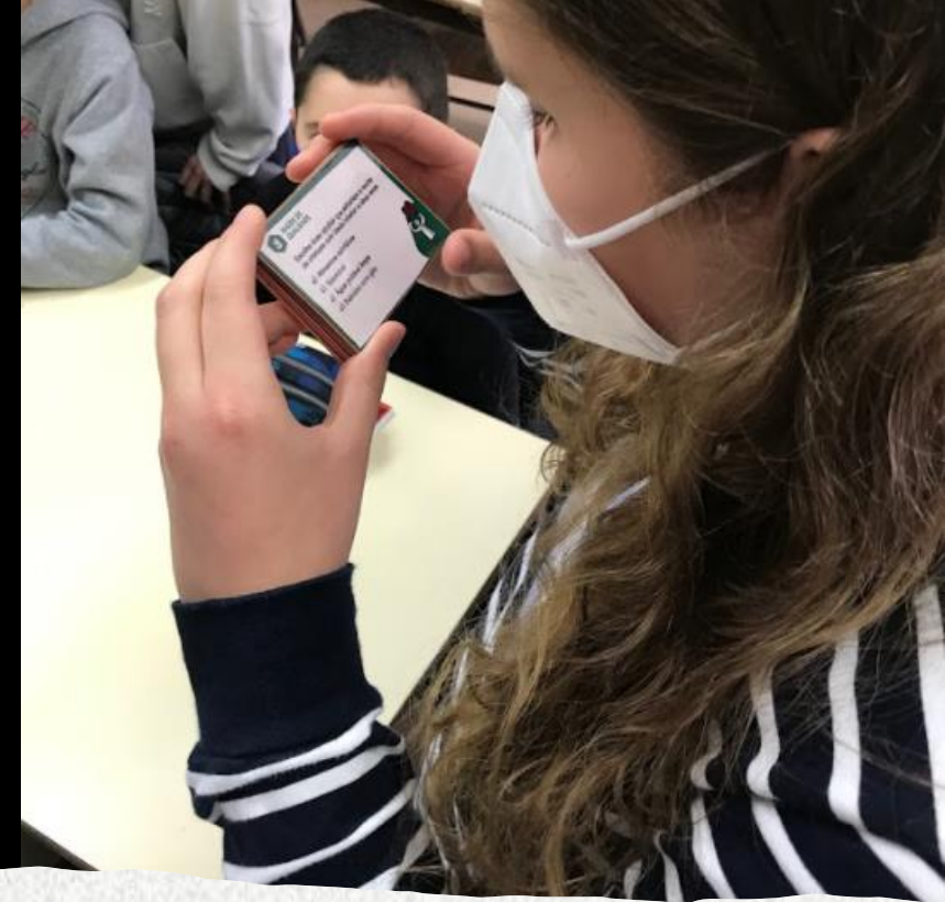
Students playing the game