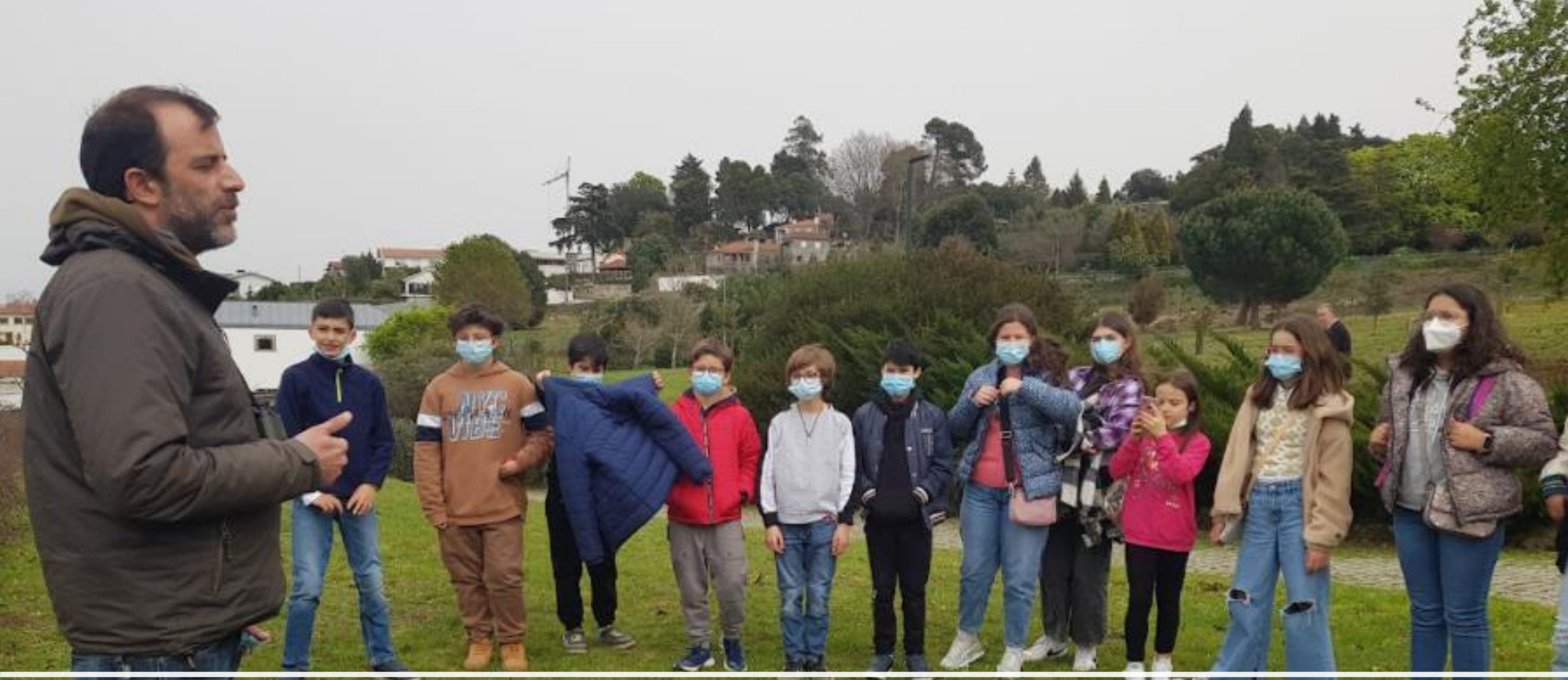
Visit the local river